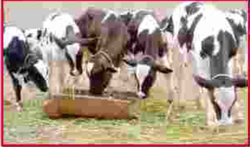
ಉತ್ತಮ ತಳಿಯ ಮಿಶ್ರತಳಿ ಕರುಗಳು