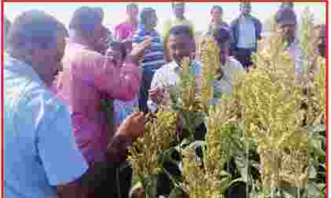
ಹೈನು ಹಾಗೂ ಅಧಿಕಾರಿಗಳು ಕೋರದ ಬೆಳೆಗಳನ್ನು ನಿರೀಕ್ಷಿಸುತ್ತಿದ್ದಾರೆ.

ಬಳ್ಳಾರಿ, ಕೊಪ್ಪಳ, ರಾಯಚೂರು ಜಿಲ್ಲಾ ಹಾಲು ಒಕ್ಕೂಟದ ನೇತೃತ್ವದಲ್ಲಿ ದಿನಾಂಕ 08.12.2016 ರಂದು ಹೋಟೆಲ್ ನಕ್ಷತ್ರ ಬಳ್ಳಾರಿ ಇಲ್ಲಿ ಕರ್ನಾಟಕ ಹಾಲು ಮಹಾಮಂಡಳ ವ್ಯಾಪ್ತಿಯ ಹಾಲು ಒಕ್ಕೂಟಗಳ ಮೇವು ಅಭಿವೃದ್ಧಿ ಅಧಿಕಾರಿಗಳು, ವ್ಯವಸ್ಥಾಪಕರು ಹಾಗೂ ಕಾರ್ಯನಿರ್ವಾಹಕ ನಿರ್ದೇಶಕರುಗಳು ಸಮ್ಮುಖದಲ್ಲಿ ಹೈನು ಅಭಿವೃದ್ಧಿಯಲ್ಲಿ ಮೇವಿನ ಬೆಳೆಗಳ ಮಹತ್ವ ಎಂಬ ವಿಷಯವಾಗಿ ಚಿಂತನ-ವಂದನ ಕಾರ್ಯಾಗಾರವನ್ನು ಯಶಸ್ವಿಯಾಗಿ ಏರ್ಪಡಿಸಲಾಗಿರುತ್ತದೆ.